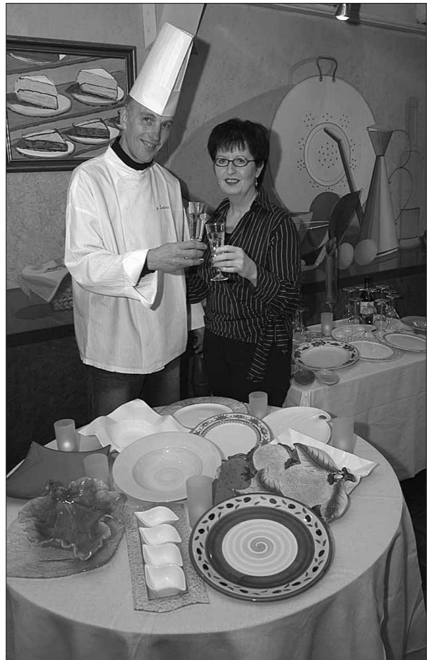
De Lantaern, een appetijtelijk adres om je feest een speciaal tintje te geven.