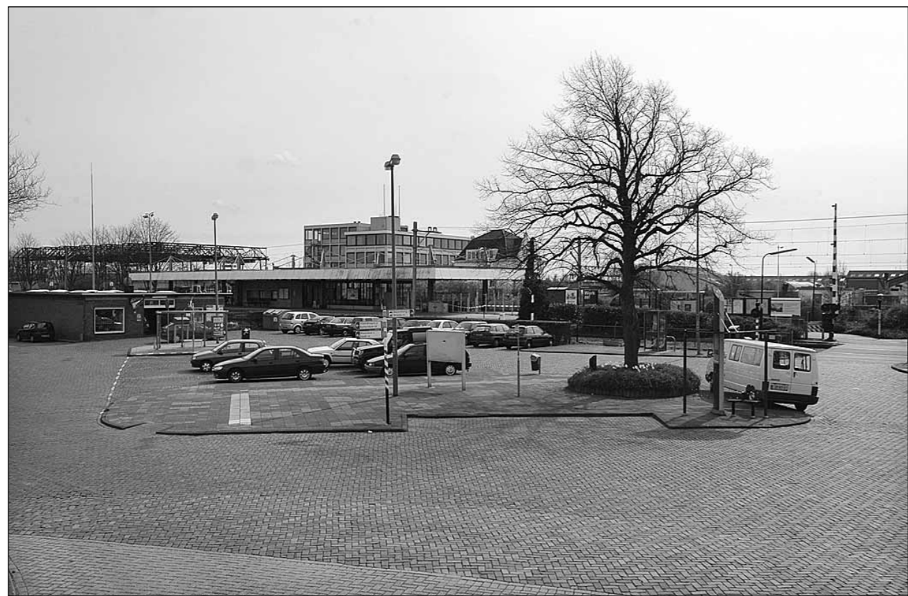
De gemeente Maassluis doet niet mee met een pilot-project camerabewaking. Onder meer omdat de kosten te hoog zijn.