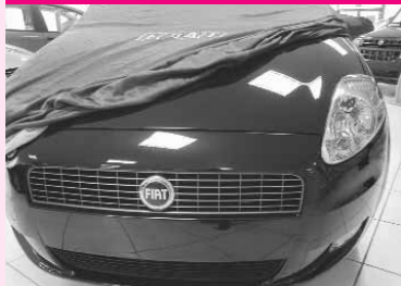
Primeur bij Fivan auto Maassluis