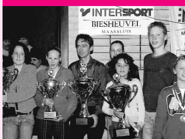
MSR huldigt kampioenen